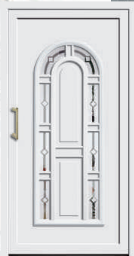
P606 / A606 mit Schmuckglas