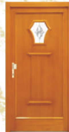
H314 (*50) Schmuckglas W3