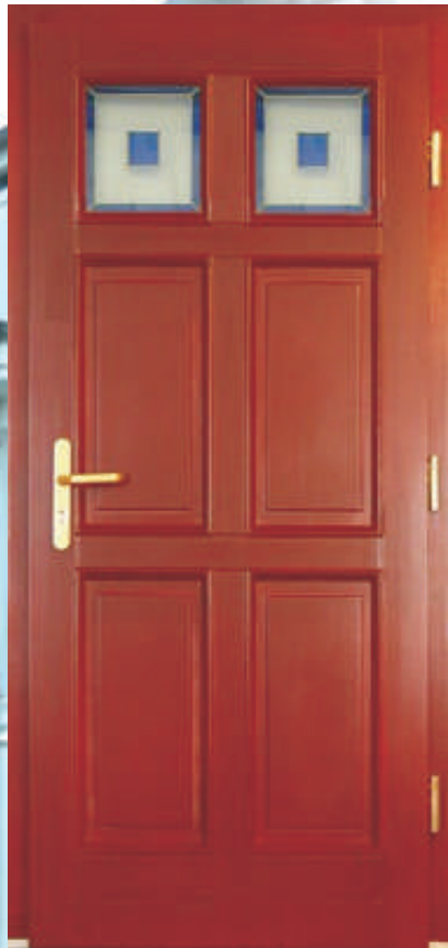
H311 (*60) Schmuckglas W1