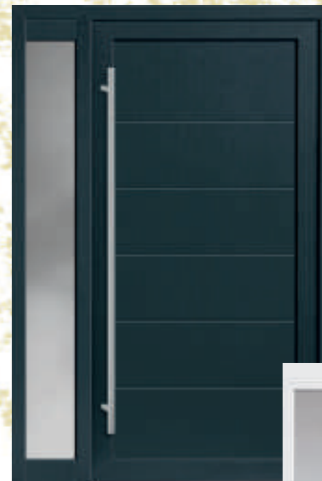
P621 / A621 Seitenteilen Typ A (*Anthrazitgrau 40)