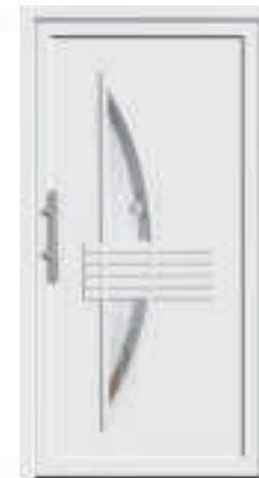
P600 / A600 mit Schmuckglas