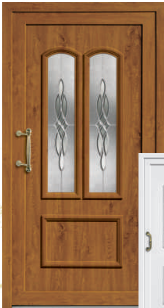
P601 / A601 mit Schmuckglas (*Golden Oak 23)