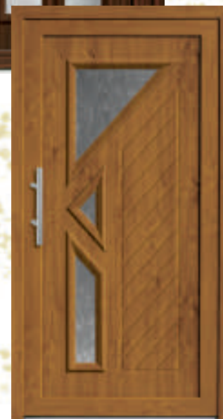
P612 / A612 (*Golden Oak 23)