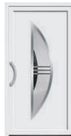
P610 / A610 mit Schmuckglas