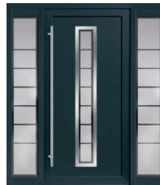
P605 / A605 mit Schmuckglas und zwei Seitenteile mit Schmuckglas (*Anthrazitgrau 40)