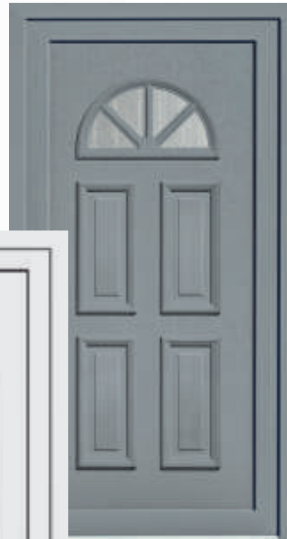
P611 / A611 (*Grau 34)