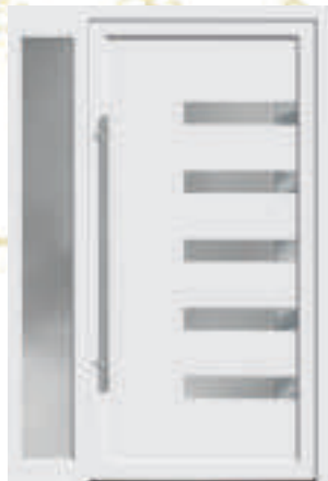
P619 / A619 mit Seitenteil Typ A