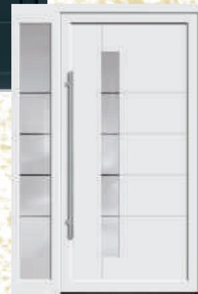
P618 / A618 mit Schmuckglas und Seitenteil mit Schmuckglas