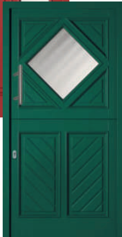
H310 (*6016) Klöntür

Die Türen H310 und H 310-1 können im oberen wie unteren Teil des Türflügels separat geöffnet werden. Schon im Mittelalter schätzten die Stadtbewohner es, wenn sie sich bei geöffneter oberer Türhälfte herauslehnen konnten, um mit ihren Mitmenschen zu klönen – so erklärt sich schließlich auch die Bezeichnung „KLÖNTÜR“. Zudem konnten Kinder und Haustiere nicht entwischen. Außerdem trat beim geöffneten Flügel Licht in die meist fensterlosen Wohndielen ein.