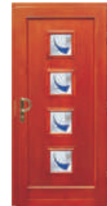
H331 (*70) Schmuckglas P1