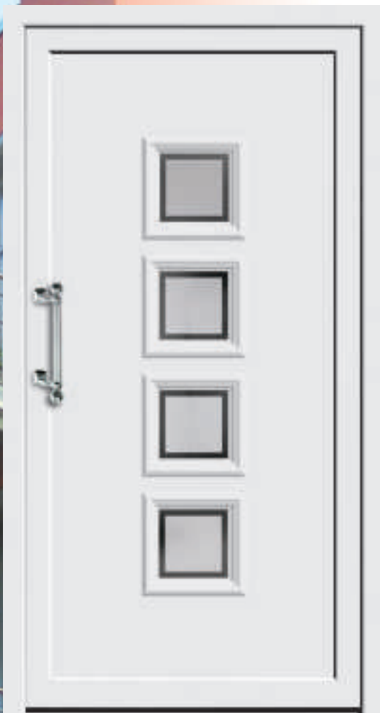
P607 / A607 mit Schmuckglas