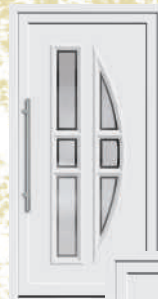
P617 / A617 mit Schmuckglas