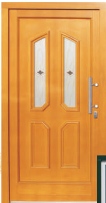
H313 (*20) Schmuckglas W3