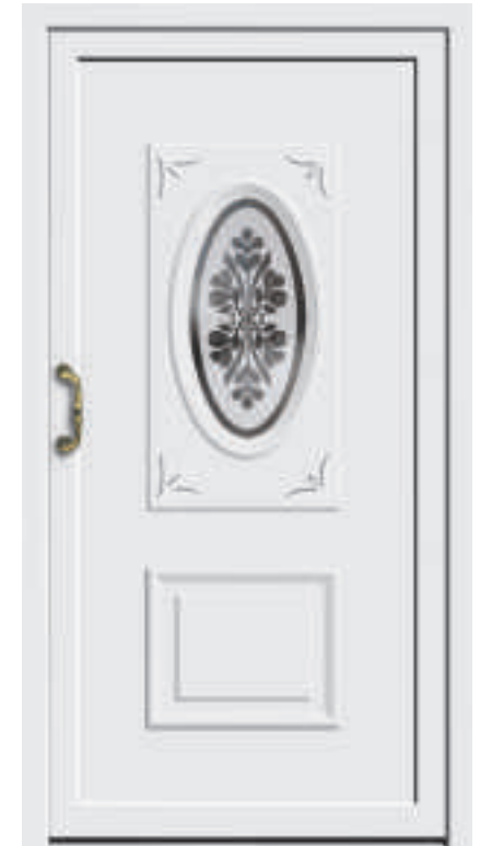
P616 mit Schmuckglas