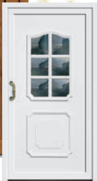
P603 / A603 mit Klarglas gewölbt