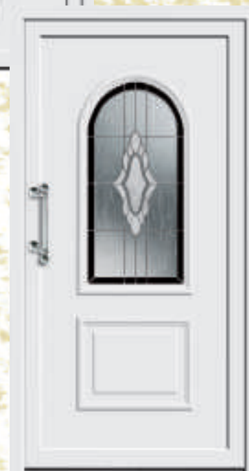
P614 / A614 mit Schmuckglas