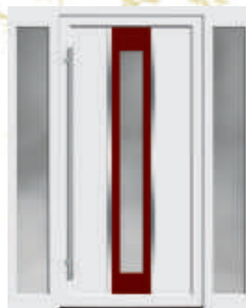
P622 / A622 mit Applikation (*Rot 32) und zwei Seitenteilen Typ A