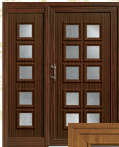
P604 / A604 mit Seitenteil 604 (*Mahogani 05)