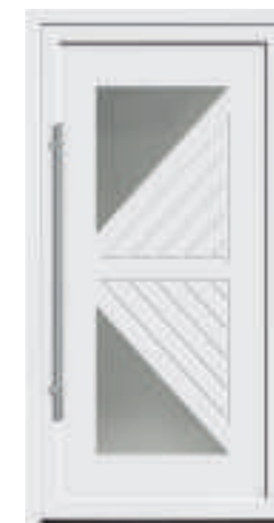
P613 / A613