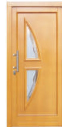
H330 (*30) Schmuckglas P2