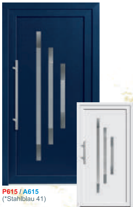
P615 / A615 (*Stahlblau 41)