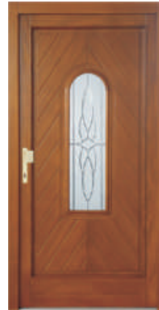
H315 (*70) Schmuckglas W7