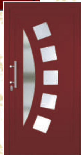
H335 (*Sonder-RAL 3004)