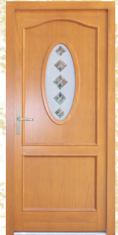
H312 (*40) Schmuckglas P1