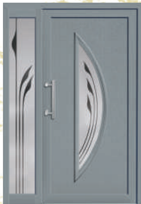
P620 / A620 mit Schmuckglas und Seitenteil mit Schmuckglas (*Grau 34)