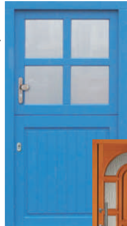
H310-1 (*5014) Klöntür